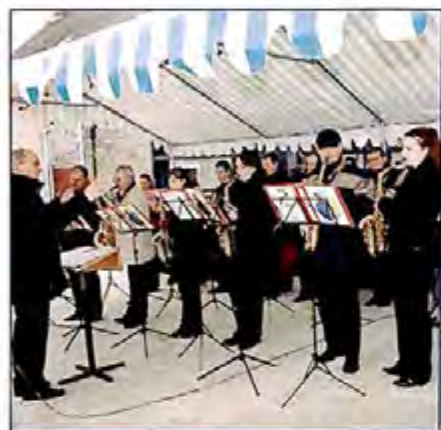
L'Amicale de Villabé a assuré l'animation de l'inauguration le samedi

Samedi et dimanche 6 et 7 décembre dernier.