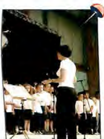
Spectacle de fin d'année