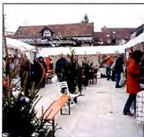
L'une des allées du marché de Noël