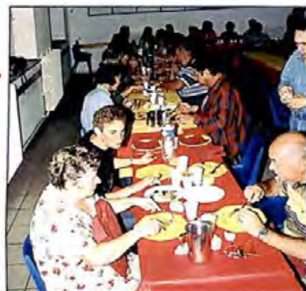
Le repas organisé le samedi soir à la salle des fêtes.