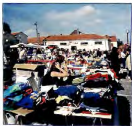
Le soleil était au rendez-vous !