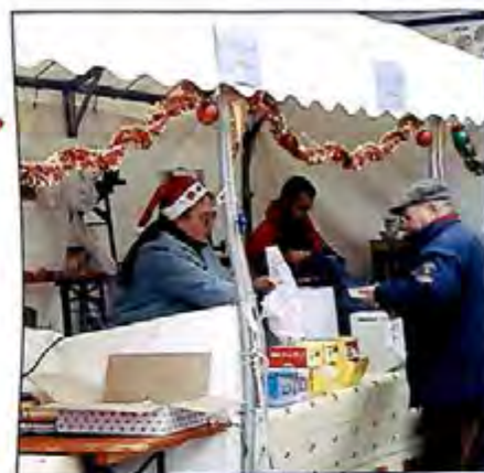
Le stand restauration a proposé divers produits tout le week-end notamment la succulente tartiflette