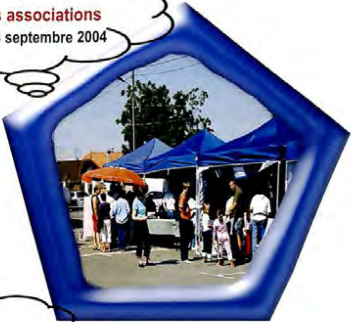
Vide Greniers : Les 24 et 25 septembre 2004