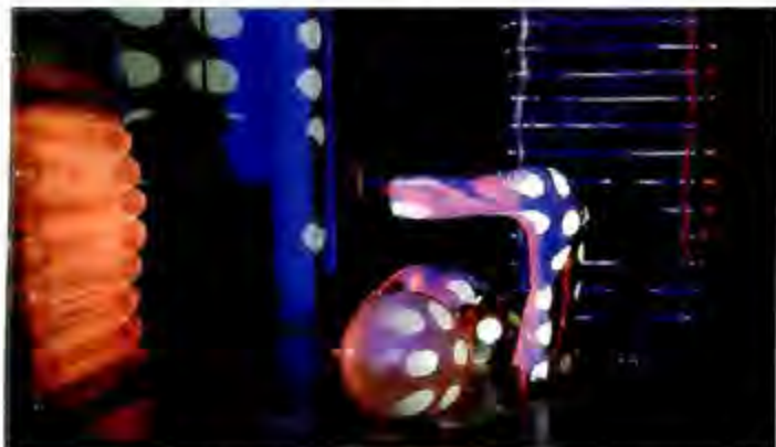
« Petites pièces chorégraphiques itinérantes »

Ensuite, c'est la Sicile de Luigi Pirandello que nous avons croisée le vendredi 10 et samedi 11 décembre au gymnase Paul Poisson, avec « A chacun sa vérité », une parabole philosophique servie sur un ton léger.