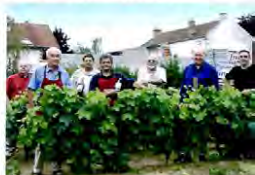
► L'équipe du Sarmant Villabéen.