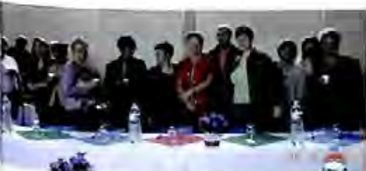
► Le groupe d'Europolyglottes.

ANGLAIS : Nous fonctionnons dans cette langue depuis maintenant plus de 9 années avec le même professeur. Les cours se déroulent en deux niveaux : lundi de 19h à 20h30 pour les personnes s'exprimant déjà dans cette langue et le jeudi de 19h à 20h30 pour les personnes ayant des bases et démarrant l'expression orale.