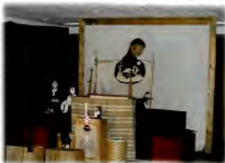
« Clair obscur »

Programmé dans le cadre du bicentenaire de la naissance de Hans Christian Andersen, ce spectacle reprend deux textes de l'auteur de « la petite fille aux allumettes ». La particularité de ce spectacle réside dans l'utilisation de papiers découpés projetés en ombre chinoise et qui servent à illustrer le récit. Le mélange de textes poétiques et de figures découpées permet au spectacle de parler aux enfants et aux adultes.