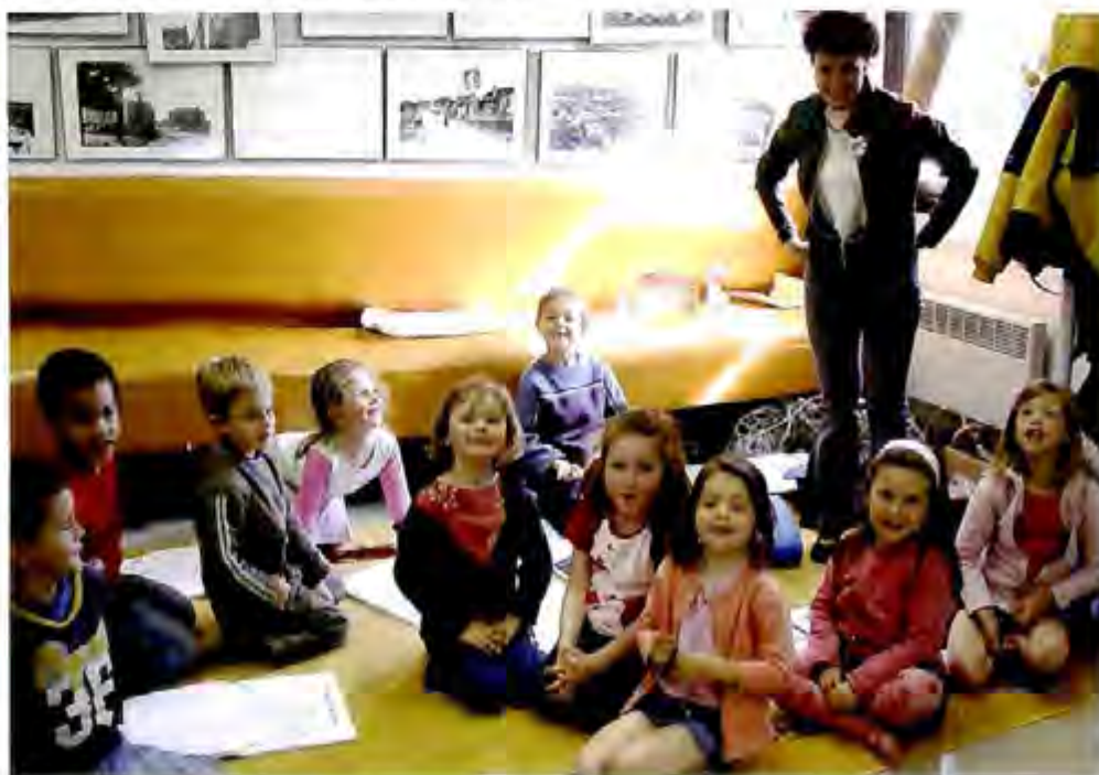
▀ Les Speak Nidouilles.