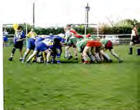
► Mêlée pour les joueurs du RCV.