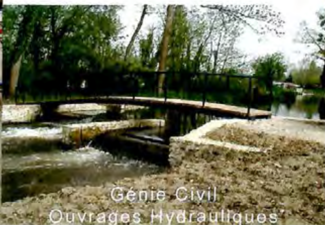
Genie Civil Ouvrages Hydrauliques