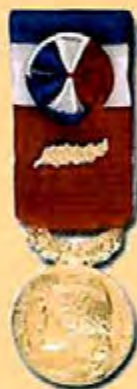
Travail 35 ans Or