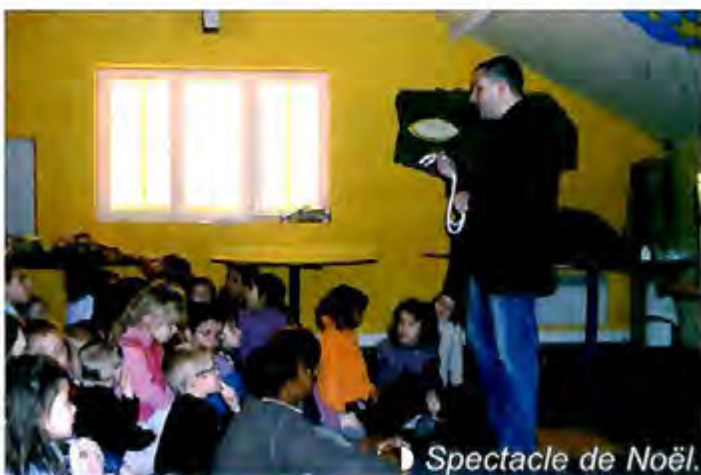
► Spectacle de Noël.

Séjours ski pour les 6-10 ans dans les Pyrénées du 4 au 11 février 2006.