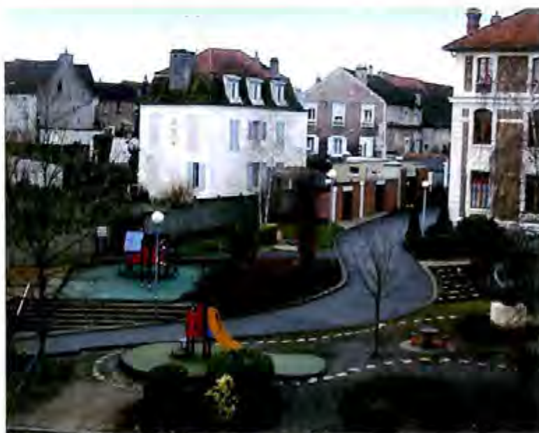
► Cour de la maternelle Jean Jaurès.

Pour la commune, le prix de revient d'une journée au centre s'élève à 69,68 € hors frais de bâtiment et d'énergie, pour les familles de 5,06 € à 20,85 €.