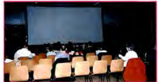
► Un samedi au cinéma : samedi 7 janvier 2006