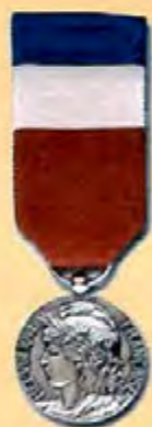
Travail 20 ans Argent