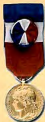
Travail 30 ans Vermeil