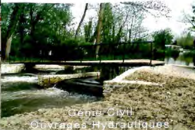
Genie Civil Ouvrages Hydrauliques