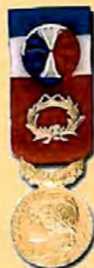
Travail 40 ans Grand Or