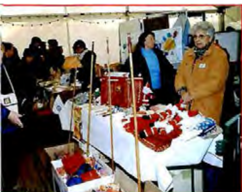
► Marché de Noël du 3 au 4 décembre 2005