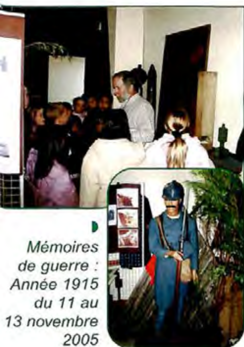
► Mémoires de guerre : Année 1915 du 11 au 13 novembre 2005