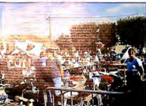
► Vide greniers, dimanche 25 septembre 2005