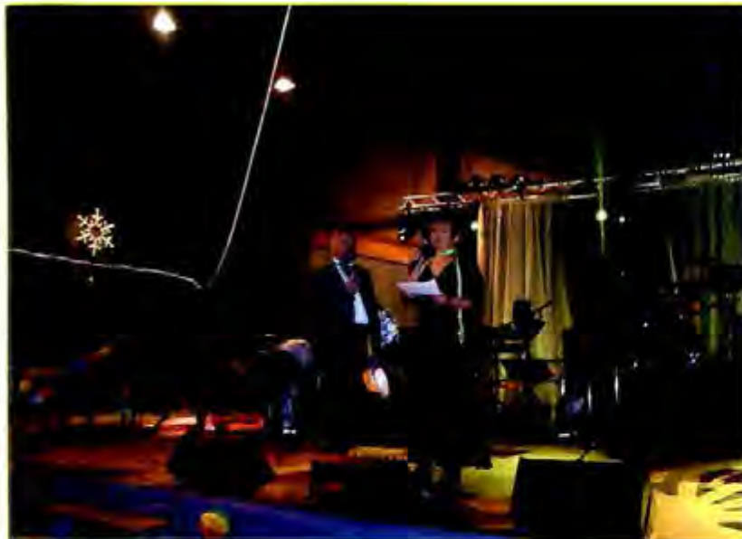
► Réveillon de la Saint-Sylvestre

Prochainement, je vous dévoilerai le contenu de cette semaine. J'espère qu'il retiendra votre attention et que vous serez nombreux à festoyer en notre compagnie.