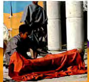
magie l'équipe d'animation