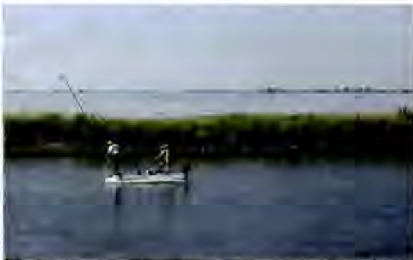
Pêche traditionnelle à l'anguille sur le Pô di Volano aux environs de Migliarino.