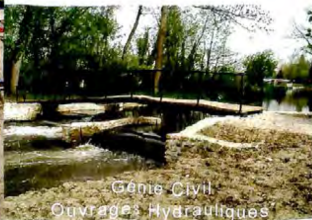
Génie Civil Ouvrages Hydrauliques