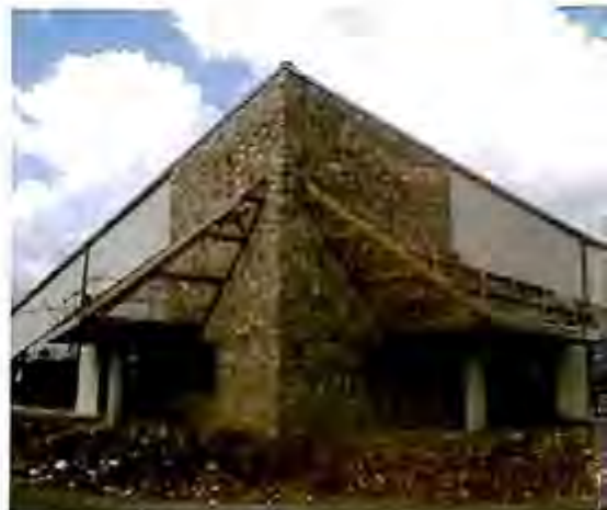
► La nouvelle salle des fêtes.

tons " qui ont été aménagés route de Villoison et rue Guillemot.