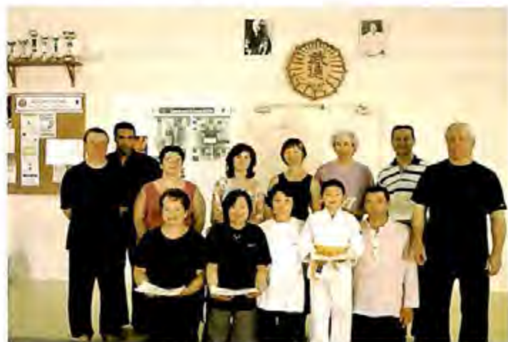
► Le club de Budokai de Villabé

Nous avons été heureux de vous recevoir au Forum des associations le samedi 9 septembre. Comme toujours, l'ambiance fut chaleureuse tout le week-end.