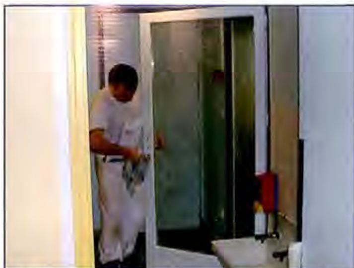
► Travaux de réfection par les services techniques