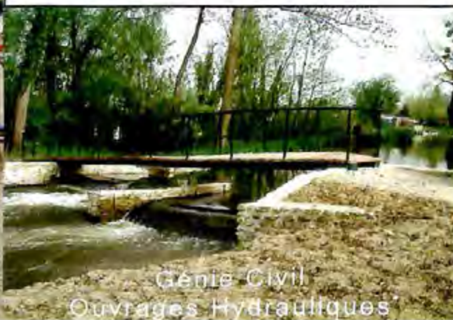
Genie Civil Ouvrages Hydrauliques