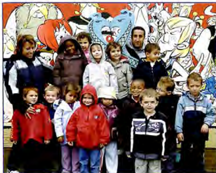
► Le centre de Loisirs les Copains d'abord en sortie au Parc Asterix