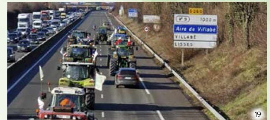
17 à 19 • Soutien aux agriculteurs